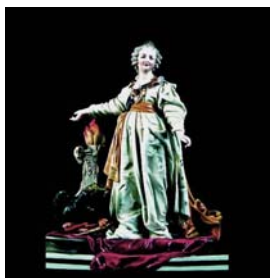
Época imperial, 1876