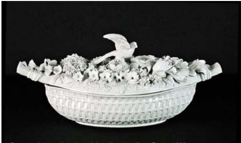
Época imperial 1862

Son interesantes las estatuillas en porcelana que nos muestran a la gente de las diferentes regiones rusas, como así también sus actividades, sus costumbres, sus fiestas, etc.