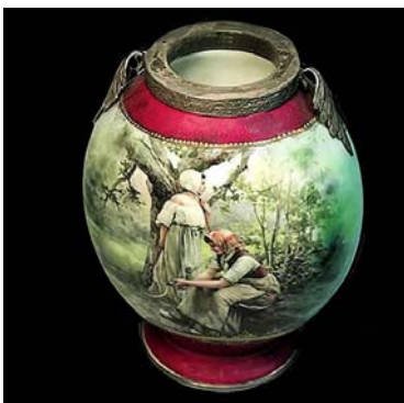
Fábrica Kuznetsov 1912