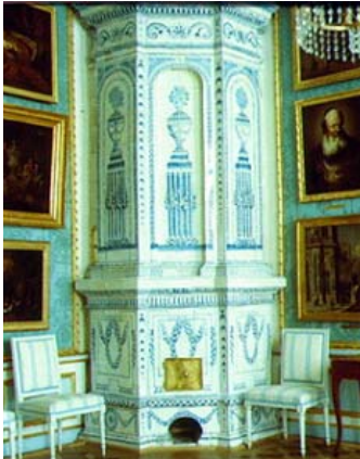
Una de las típicas chimeneas (estufas) de cerámica de Europa del este, en el palacio Kuskovo

El conjunto del palacio y parque de esta finca campestre se terminó de edificar en la segunda mitad del s. XVIII, su dueño había sido un alto dignatario de la corte imperial rusa, gran coleccionista de arte. Quiso que su residencia se transformase en un gran centro de arte. Esas posesiones se nacionalizaron en 1918, recibiendo la categoría de Museo, que conservó los fondos artísticos de la finca. En 1931 se ubicó allí el Museo de Porcelana que se denominó con posterioridad Museo Nacional de cerámica. En 1938 se denominará Complejo Finca de Kuskovo y Museo Nacional de Cerámica.