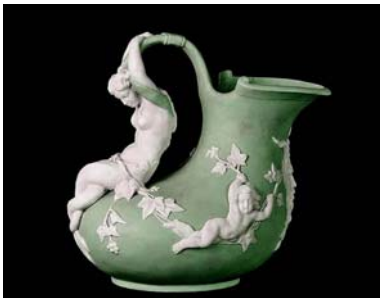
Jarro de porcelana imperial, diseñado por Daladunguin, Rusia, 1876

Con la ascensión al trono de Pablo I, la decadencia de la Manufactura imperial se acentúa. Los esmaltes son policromos con gran abundancia de dorados y las escenas se toman de la vida diaria. Lo mismo acontece para las demás manufacturas privadas.