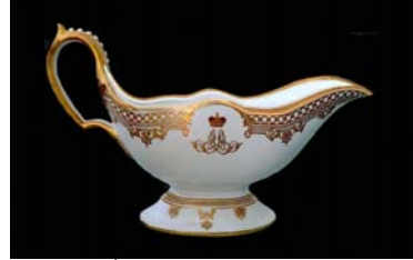
Vajilla. Época de Alejandro III. 1872

Si bien la porcelana de la primera época imita a la de Meissen en sus productos de utensilios suntuarios y estatuillas, la producción de época de Catalina tiene como referente a la porcelana de Sèvres. Esto es a partir del año 1763 y también comienza en esta época una producción de cerámicas comerciales, grisáceas y amarillentas, cuya venta popular ayudaba a compensar los grandes gastos que requería la Manufactura pues esta se dedicaba especialmente a realizar piezas únicas, cuyos destinatarios pertenecían a la corte y no se comercializaban.