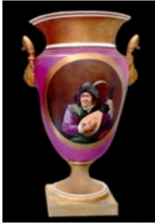
Porcelana rusa. Gran ánfora con motivos populares 1819