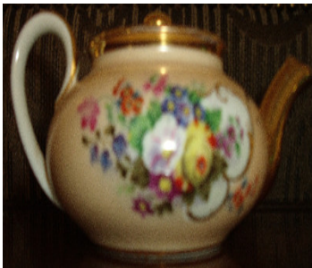
Pieza de un Juego de la Fábrica Popov cerrada en 1875- Siglo XX