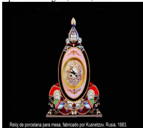
Reloj de porcelana para mesa, fabricado por Kusnetzov, Rusia, 1883.