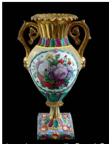
Princesa Ana Petrovna, plato de porcelana rusa, 1789. Jarrón de porcelana decorado a mano, Rusia, 1796 1

En 1764 se funda la fábrica del inglés F. Gardner en la ciudad de Moscú que será vendida en 1891 a Kouznetsov pero actualmente volvemos a encontrar que esa firma está en funcionamiento. Luego aparece la de Popov fundada por otro inglés, CH. Milly; la de Kiew-Mejogoris que se instala en 1799; Baranovka en 1801; Nassonov en 1811; Battenine en 1817; Koslov en 1820; Kurnilov en 1835 y Miclachevsky en 1839. Para fines del siglo XIX ya existían en Rusia unas 50 fábricas privadas, mientras que la fabricación imperial de buen nivel se mantuvo hasta la revolución Bolchevique de 1917.