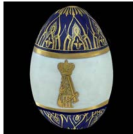
Huevo de Pascua. Manufactura imperial, 1891